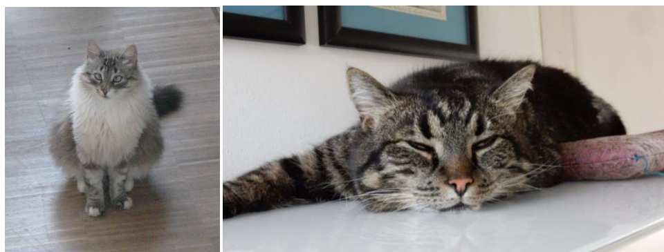
Die beiden Bürokater haben nun alle Informationen zusammengetragen und gönnen sich jetzt eine Pause.

Mit Ihrer Bestellung akzeptieren Sie die Allgemeinen Geschäftsbedingungen / online Steuer Nummer : 3117 / 233 / 02155 USt. Id. Nummer : DE 307 464 768 AGBs: www.artlight-magazine.com