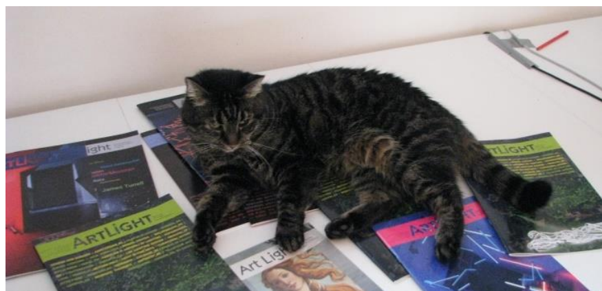
Unser Bürokatze wird Ihnen ein wenig helfen. Miau!

— Ihr interaktives Marketing aus dem ArtLight Verlag