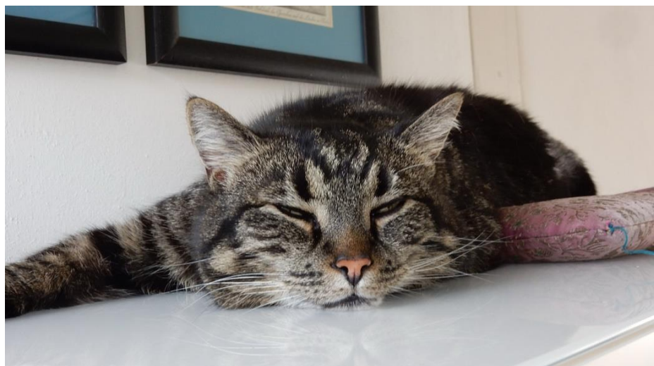
Der Bürokatze hat nun alle Informationen zusammengetragen und gönnt sich jetzt mal eine Pause.

Mail: info (at) ArtLight-Magazine.com | Telefon: +49 (0)3946 – 8191065